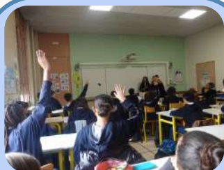
Découvertes LV2 Page 2