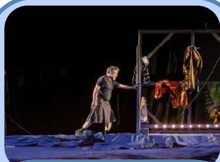
Les sorties spectacle du mois Page 8-9