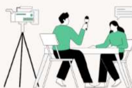
Les ITV Pages 10-13