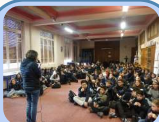
La fête de Sion Pages 4-5