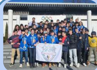
Sortie à Lausanne Page 7