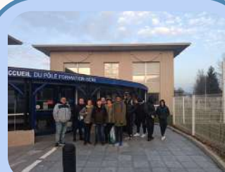
Sortie orientation Page 3