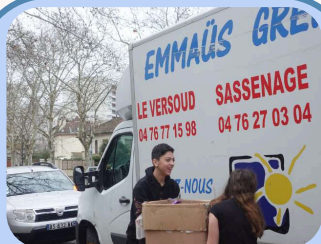
Collecte de jouets Page 1