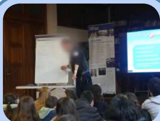
Une journée prévention Page 6